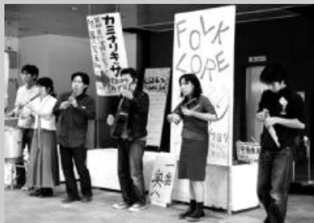
昨年の雙峰祭の一コマ(フォルクローレ愛好会/芸サ連)

アカペラサークルDoo-Wop Acappella on the Street (体芸棟脇ステージ)10:00~18:00 10/6・8 ライブステージ(松美池ステージ) E.L.L. 10/6・8 ライブステージ(一学食堂)12:00~ 10/7 ライブステージ(水上ステージ)10:00~ 合唱団むくどり 10/6・8 ライブステージ(松美池ステージ)13:00~14:30 ギター・マンドリン部 10/8 コンサート(大学会館ホール)14:00~14:30 つくばフォーク村 10/6 ステージ(水上ステージ) 10/7 ライブハウス(1E208)終日 津軽三味線倶楽部無絃塾 10/7 ライブ(図書館前特設ステージ)7:25~8:05 Jazz愛好会 Full House(52C01)10:00~20:00 ピアノ愛好会 10/8 コンサート(大学会館ホール)午前中 ブロックプレーテ同好会 10/7 ステージ(大学会館ホール)10:00~ 落語研究会 落語(体芸棟2階)10:00~21:00 写真部 写真展(大学会館第6会議室)10:00~17:00 書道クラブ 書展(大学会館第2会議室)10:00~17:00 焼き物を作る会 大展示即売会(体芸棟2階)