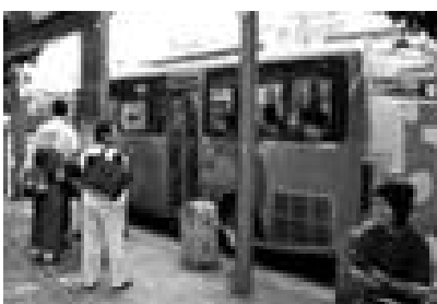
研究対象のコミュニティーバス

社会学類都市計画専攻では実習の一環として、夏休みにインターンシップへの参加を行っています。私は7月30日から8月10日までの2週間、東京都でインターンシップ研修を受けました。東京都では今年度からインターンシップ生を受け入れることになり、その第1期生として東京都立大学、早稲田大学、日本大学などから33名が参加し、それぞれの部署に配属されました。私は都市計画局施設計画部交通企画課でインターンシップ実習を行いました。目的は東京の交通政策を現場見学も交えながら学んでいき、報告書