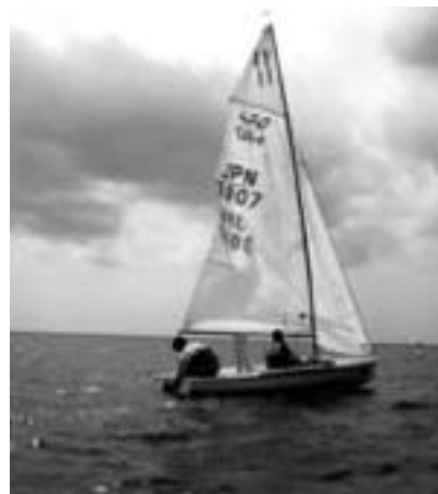
青い海に浮かぶヨット

熱い夏合宿を終え、現在は10月に神奈川県葉山町森戸海岸沖で行われる秋季インカレ予選に向けて練習中である。 (寄稿/高松俊邦 ヨット部・工シス2年)