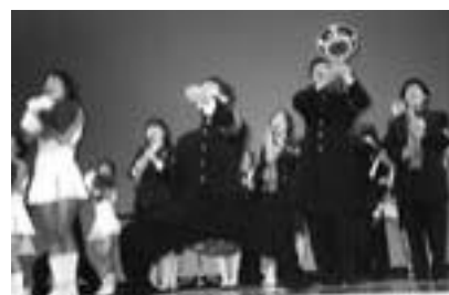
昨年の演舞会「桐葉ノ舞」より