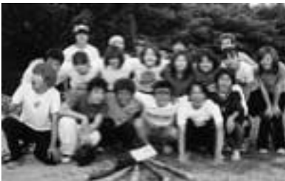
文サ連ソフトボール大会に笑顔で優勝

「野外活動クラブ」は、設立から今年で28年目を迎えました。キャンプ、登山などを主な活動としています。また、毎年夏休みには対外行事として、つくば市近郊の小学生を対象とした、「子供村サマーキャンプ」を行っています。今年度の子供村サマーキャンプは、群馬県高山村のキャンプ場で二泊三日で行いました。天体観測や肝だめし、キャンプファイヤー、ハイキングなどを楽しんでもらいつつ、自然というものを感じてもらいました。我々としては、反省する点多々ありましたが、後日集めた子供たちの感想文のすべてに「楽しかった」、「来年もまた参加したい」という文字があるのを見ると、やって良かったと思うと共に、来年はもっと良い活動にしようというエネルギーにもなりました。