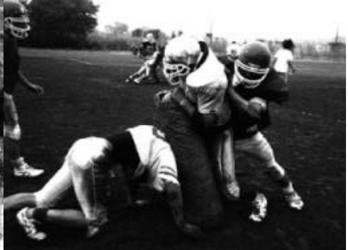
写真 左上：海洋研究会(文サ連)夏合宿 左：野生動物研究会(文サ連)夏合宿 上：アメリカンフットボール部(体育会)夏合宿