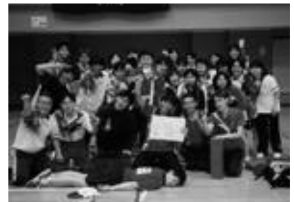
東医体二連覇を成し遂げた医学卓球部