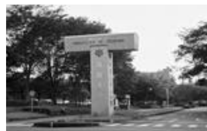
大学中央口に作られた案内表示塔

また、以前はこれといった目印がなく分かりにくかった大学の中央口に、御影石製の案内表示塔が建てられた。T字をかたどったこの表示塔には、「筑波大」、「トップを目指す」、「サーティー(30周年)」の意味が込められているという。昼間はどっしりと構えているこのT字は、夜になるとライトアップされ、なかなか幻想的である。筑波大の新たなシンボルとなるかもしれない。(取材/芸サ連広報局員 大久保直美・日2年)