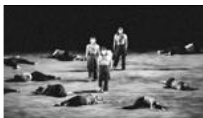
踊り尽くしたラストシーン

今回、私たちは「人間はなぜ踊るのか」というダンスの根源に立ち返り、本来の自分の在り方に出会うことをテーマとした。腹の底から湧き上がるような声と重低音が響き合うアフリカの民族音楽を使い、体から湧き上がる胴体の動きを中心に振りを作成した。“生身の人間感”を出すために衣装にも工夫を凝らし、上半身は肌の色に近いものなるべく体に沿わせ、下半身は土の色に近いもので風に自然になび