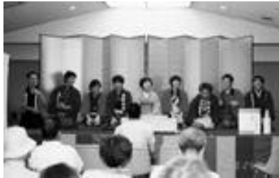
大喜利で盛り上がる会場

当日は、日曜の午後でかつデパートと同じ建物に会場があるという好条件に恵まれたため、いつも以上にお客さんが来てくれました。このため全員がかなりのやる気を持って演じることができ、良い落語会にすることができました。今回は落語をメインにコントと大喜利を間に挟む形式で行いました。大喜利は本来、全出演者が一度に舞台に出て寄席の最後に行われるのが慣例なのですが、落語会自体の時間が長いために最初から最後まで見られないお