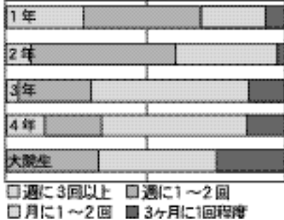
Q.コミュニケーションの頻度について(グラフ1)

それ以上の学年では月に1~2回が最も多くなっていました。特に、週に1回以上の頻度で連絡を取っている学生は、1・2年生で6割以上であるのに対して、3年生以上では3割程度、大学院生で殆どいませんでした。学年が上がるにつれて、あまり連絡を取らなくなっていくことが明らかになりました(グラフ1参照)。