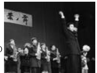
昨年の演舞会「桐葉ノ舞」より

私達は日頃、体育会各部の応援を中心に活動しています。しかしこの桐葉ノ舞ではその活動の集大成として、一年間培ってきた応援技術を余すところ無く披露いたします。内容はリーダー部・チアリーダー部・マーチングバンド部の三部による演舞、つくばおろし、チアリーディング、マーチングドリル、演芸などです。入場料は無料となっていますので、皆様お誘い合わせの上、是非ご来場下さい。