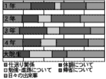
Q.会話の内容について(グラフ2)

るためなのかもしれません。また、4年生以上では、勉強・進路について話している学生の割合が高くなっているのも特徴的です。厳しい就職状況が続く昨今、進路や就職活動のことで親御さんと連絡を取り合う機会が多くなるのかもしれません(グラフ2参照)。