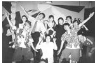
舞台を終えての笑顔で記念撮影

それゆえ当劇団は、非常に自由な活動ができる環境になっております。やりたいと思った人間が企画し、2~3ヶ月に一本の割合で舞台を作っています。如何せん今は劇団員が少ないため、役者も舞台を作るスタッフを兼ね