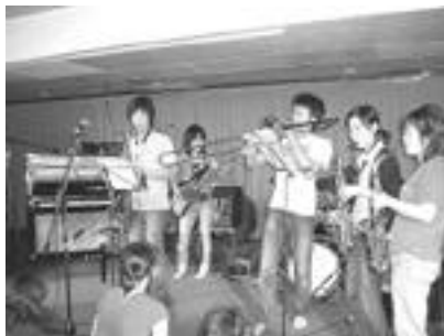
本番セッションの様子

J A Z Z 愛好会は自分たちでジャズを学び、そして演奏するサークルです。まず普段の活動としては、週に一度行われるミーティングとセッションが挙げられます。セッションは言わば演奏会のようなもので、各自がここで練習の成果を發揮します。普段の練習には個人練とバンド練があります。J A Z Z 愛好会の練習場所、文化系サークル館D室は朝7時から夜10時まで開放されているので、個人個人が自分の暇を見つけては好きな時に練習しています。そして週に一度、バンドメンバーが集まって練習します。セッションとバンド練では、バンド練が決まっ