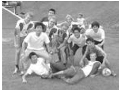
デンマーク代表との記念撮影(本人左下)

みなさんは、見知らぬ土地に行く時に何をしますか？おそらく多くの人は地図を入手して、その地図を頼りに土地についてのイメージを持つものと思います。オリエンテーリング(以下OL)はよくわからない森林の中で地図を見ながら自分自身を案内する、そんなスポーツです。OLでは市街地や観光地ではなく、丘陵の林や大きな公園がフィールドとなります。