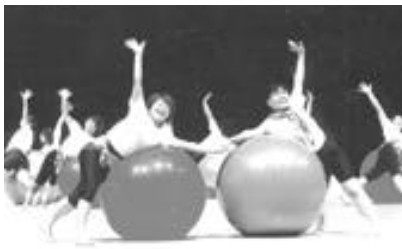
Gボールを使った作品「日本の夕べ」

私たち体操部は、7月20日から26日までの一週間、ポルトガルのリスボンで開催された12th World Gymnaestradaに参加してきました。Gymnaestradaという名称はGymnastics(体操)と、estrada(道)という2つの単語からなる造語で、四年に一度開催される体操界最大の世界的祭典です。今回は、世界46か国から約25000人が大会に参加しました。