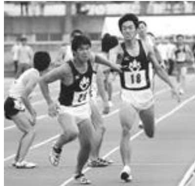
男子4×400mRアンカーへのバトンパス

8月26日から30日まで第52回関東甲信越大学体育大会がつくば市・水戸市・宇都宮市を会場として行われ、17の競技の熱戦が繰り広げられた。今回筑波大学は主管当番校であり、筑波大学が会場となった陸上・テニス・バスケットボール・卓球・剣道の各クラブと学生部・体育センターが協力して運営にあたった。