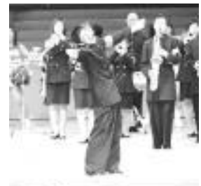
昨年の演舞会の様子

私たちは日頃、筑波大学の体育会各部の応援を中心に活動しております。この桐葉ノ舞ではその活動の集大成として、今まで培ってきた応援技術とその成果を余すところなく皆様に披露致します。内容はリーダー部・チアリーダー部・マーチングバンド部の三部による演舞、つくばおろし、チアリーディング、マーチングドリル、演芸など盛り沢山です。入場料は無料となっておりますので、皆様お誘いあわせの上、是非御来場下さい。