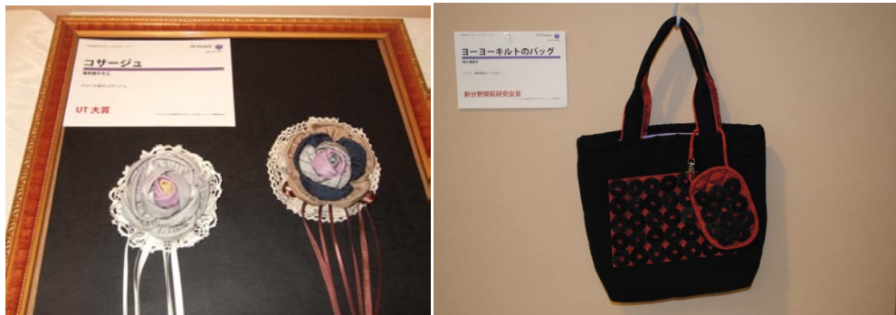
(上左) 大賞「コサージュ」(海老根すみ江)